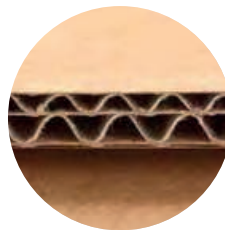
Dobbel/ dobbel 2-lags