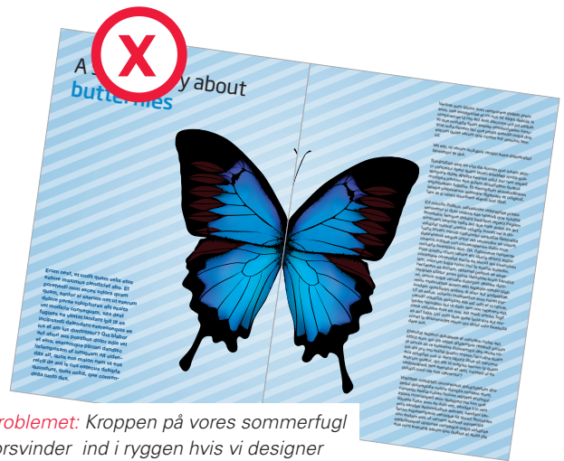
Problemet: Kroppen på vores sommerfugl forsvinder ind i ryggen hvis vi designer uden at tage højde for ryggen med buk.

Bemærk: Problemet gør sig kun gældende ved grafik som strækker sig fra omslag til indhold. Opslag henover indholdssiderne designes på almindelig vis ligesom et hæfte.